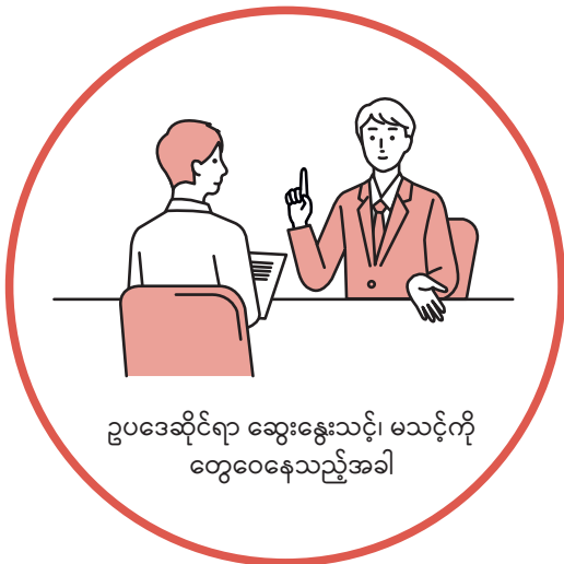
ဥပဒေဆိုင်ရာ ဆွေးနွေးသင့်၊ မသင့်ကို တွေ့ဝေနေသည့်အခါ