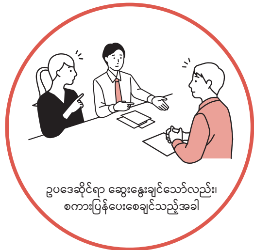
ဥပဒေဆိုင်ရာ ဆွေးနွေးချင်သော်လည်း၊ စကားပြန်ပေးစေချင်သည့်အခါ