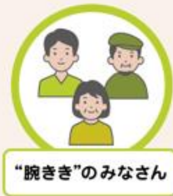
“腕きき”のみなさん

マッチングプラットフォーム「GRANT」に 登録して、「まちの腕きき掲示板」に掲載のプ ロジェクトをご確認ください。