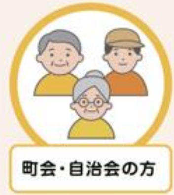
町会・自治会の方